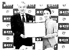
連携協定締結式 (5月27日)