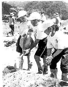
甲子小学校3学年によるラベンダーの定植 (7月4日)